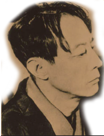
▲萩原朔太郎 © 前橋文学館