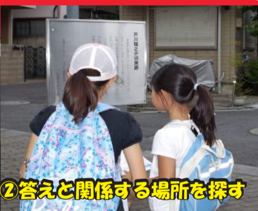
②答えと関係する場所を探す