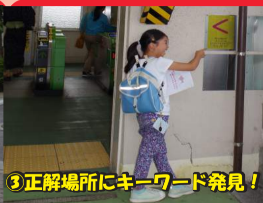
③正解場所にキーワード発見!