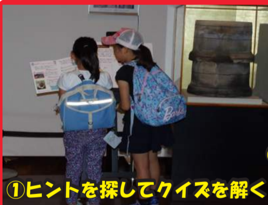
①ヒントを探してクイズを解く