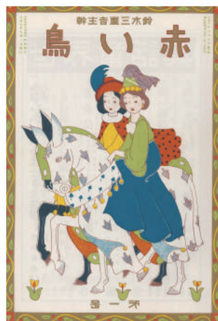
田端文士・芸術家が寄稿した児童雑誌