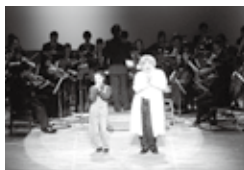
過去の公演の様子