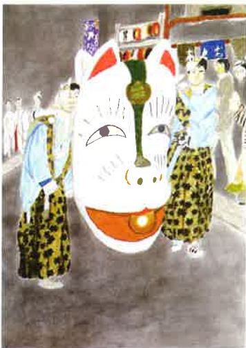
© 堀口貴太 / NPO 法人 あいアイ