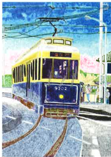
© 渡戸忠 / NPO 法人 あいアイ